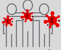
غالبية الحالات تقع بين عمر 69-30

أظهرت التحليلات الوبائية التي أجرتها منظمة الصحة العالمية ومراكز مكافحة الأمراض أن الأشخاص الأكثر عرضة للموت بسبب فيروس كورونا المستجد (كوفيد-19) ينتمون إلى المجموعات المستضعفة متضمنة كبار السن وذوي الأمراض المزمنة ومن يعانون من نقص المناعة مثل الأشخاص الذين يعانون من أمراض القلب والسكري وأمراض الجهاز التنفسي ويجب أن يكون هؤلاء في بؤرة جهود المواجهة.