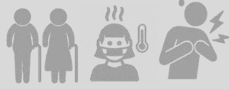
تقع أعلى أرقام الوفيات بين كبار السن والأشخاص الذين يعانون من حالات مرضية من قبل