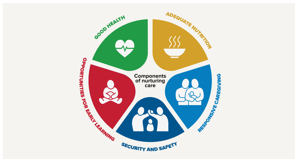
IMAGE : Cadre pour des soins attentifs pour le développement de la petite enfance

de bénéficier d'une santé optimale et du meilleur développement physique et émotionnel possible. Dans des contextes d'urgence et de crise, les soins attentifs protègent aussi les enfants des répercussions de l'adversité (UNICEF et al. 2020). Le Cadre pour des soins attentifs s'intéresse principalement à l'enfant entre la grossesse et l'âge de 3 ans car peu de programmes ciblent cette période critique du développement cérébral de l'enfant.