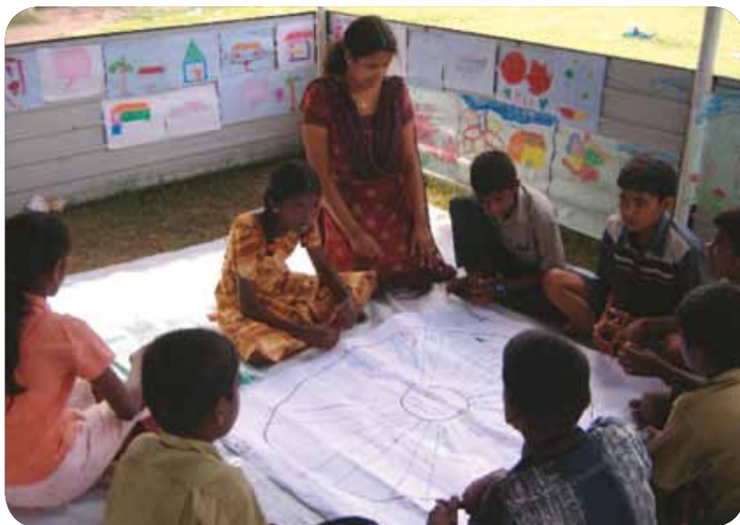
Raseljena djeca učestvuju u aktivnostima crtanja u privremenoj školi u Šri Lanki.

Uključivanje djece i mladih – i onih koji pohađaju i onih koji ne pohađaju škole – je od presudnog značaja. S njima treba razgovarati o rodnim razlozima uključenosti, odnosno isključenosti iz pristupa obrazovanju. Otkrijte kakvu podršku oni smatraju potrebnom onima koji već imaju pristup formalnom i neformalnom obrazovanju i onima koji ne pohađaju škole. Primjer aktivnosti dat je u Dodatku 2 – Kartica propusta može se koristiti s učenicima da se utvrdi koji dječaci i djevojčice nisu u prilici da pohađaju školu i zašto.