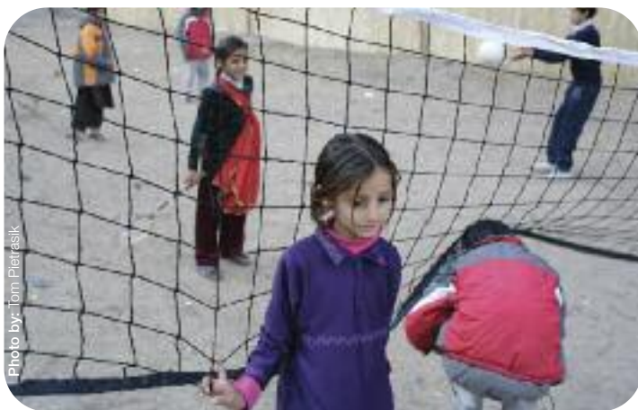
Des enfants dans la zone de jeu sûre au Camp d'assistance de Thuri Park, à la suite du tremblement de terre de 2005 au Pakistan