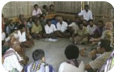
Réunion du personnel de Save the Children avec des chefs communautaires et des membres du comité de l'école dans la région de Fatubai, dans le district de Kefa, Timor Occidental