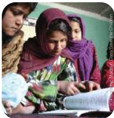
Des filles dans un programme de formation accélérée à Mazar-e-Sharif, dans le Nord de l'Afghanistan