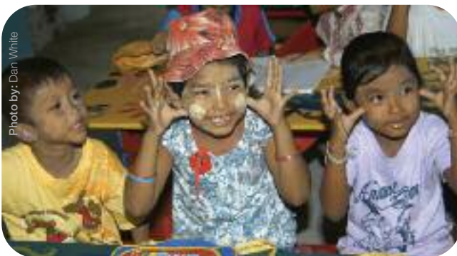
Des enfants participants aux activités du Centre d'apprentissage des migrants pour les enfants birmans affectés par le tsunami. Parakang Cape, District de Takua Pa, Thaïlande.