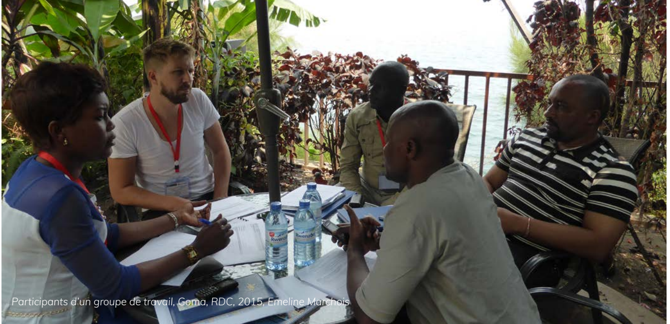
Participants d'un groupe de travail, Goma, RDC, 2015. Emeline Marchais