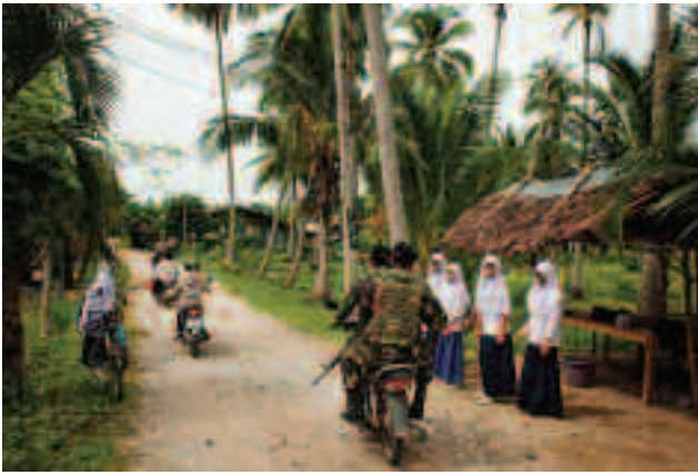
(บน) ขบวนการในความอารักขาของกองทัพ เคลื่อนผ่านกลุ่มเด็กขณะออกจาก โรงเรียน

(ขวา) คุณครูผู้หนึ่งยกบินที่ขาบอกว่าคุณคือผู้เป็นประจำไว้ใจ แม้จะกำลังสอนเด็กที่ โรงเรียนประถมศึกษากันสองชั่วโมง ปกติคุณครูผู้หนึ่งบอกว่าการถูกโจมตีโดย ผู้ก่อการร้ายยังคงมีผลต่อเด็ก ๆ ที่โรงเรียนได้ของจริง จึงพลาดการเสียชีวิตมาก ผู้ปกครองและนักเรียนบอกว่าคุณภาพการเรียนการสอนลดลงเนื่องจากความกังวลเรื่อง ความปลอดภัยของคุณครู “ครูไม่มุ่งมั่นกับการสอน” แต่ผู้หนึ่งบอก