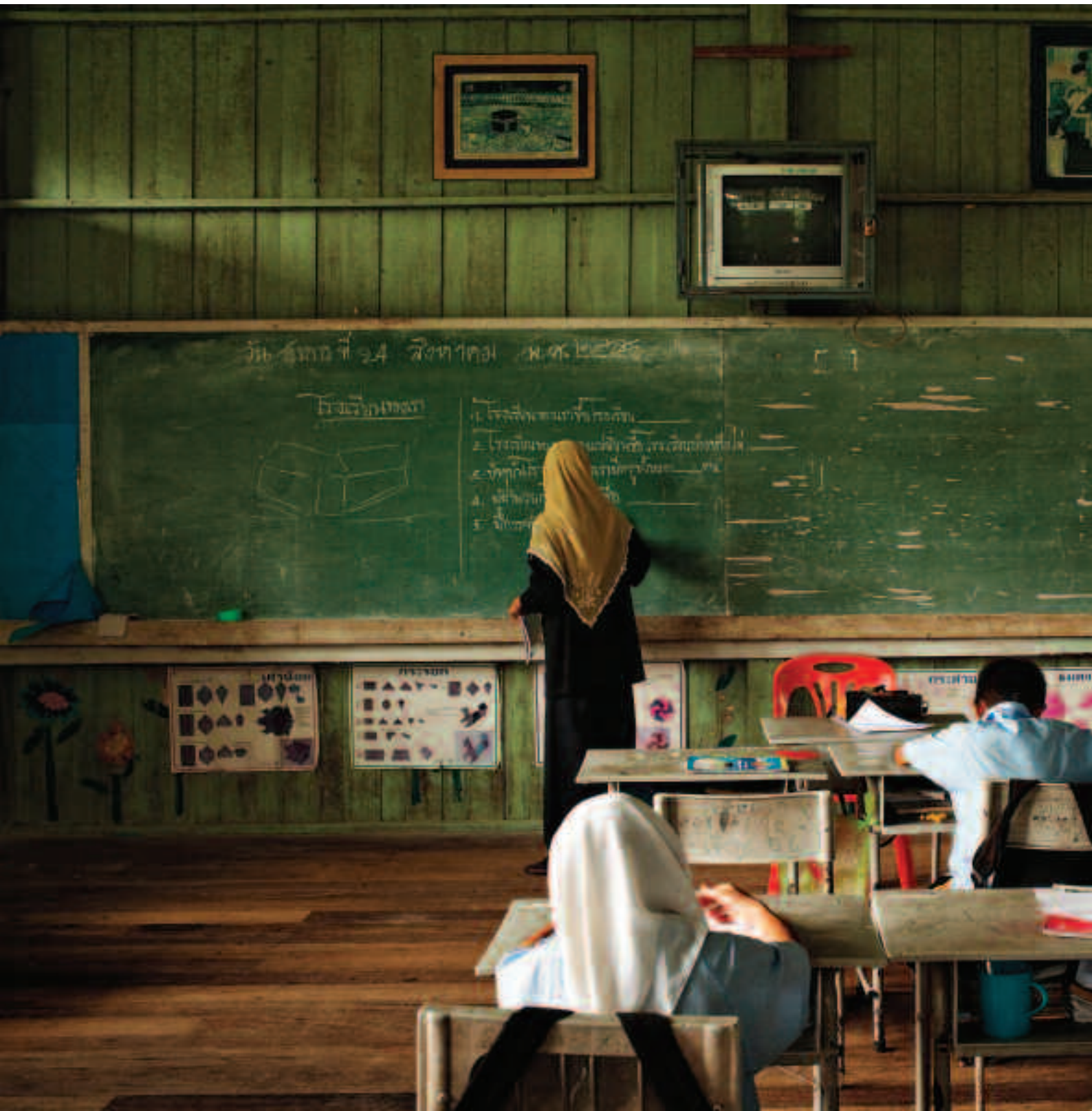
คุณครูและนักเรียนประถมศึกษาบ้านคลองช้าง ปัตตานี คนท้องถิ่นผู้หนึ่งเล่าให้ Human Rights Watch ฟังว่า มีนักเรียนประมาณ 80 คนลาออกจากโรงเรียนภายหลังที่หน่วยทหารพรานเข้ามาตั้งฐานอยู่ในโรงเรียน ขณะนี้มีนักเรียนเหลืออยู่ราว 90 คน