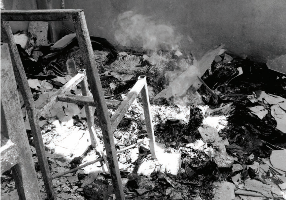
รูปที่ 4 กองหนังสือที่ไหม้เกรียมในห้องสมุดโรงเรียนประถมศึกษา บ้านนาโง บัตตานี 5 วันหลังจากที่กลุ่มผู้ก่อความไม่สงบวางเพลิงที่โรงเรียน เมื่อวันที่ 19 มีนาคม 2553