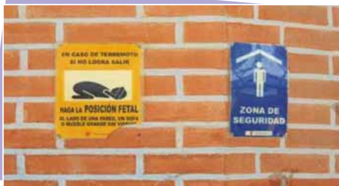
Señalización en la UE

Aunque se ha dotado de materiales y equipo necesario para situaciones de emergencia, el uso adecuado de los mismos (Ej, extinguidores y sirenas ) no esta aun probado. En el caso de los extinguidores, el 2011 solo la cocinera , secretaria y profesores de computación recibieron un curso de cómo usar este equipo, conocimiento que no ha sido compartido y menos probado.