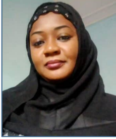
هديثو أم علي (نيامي)