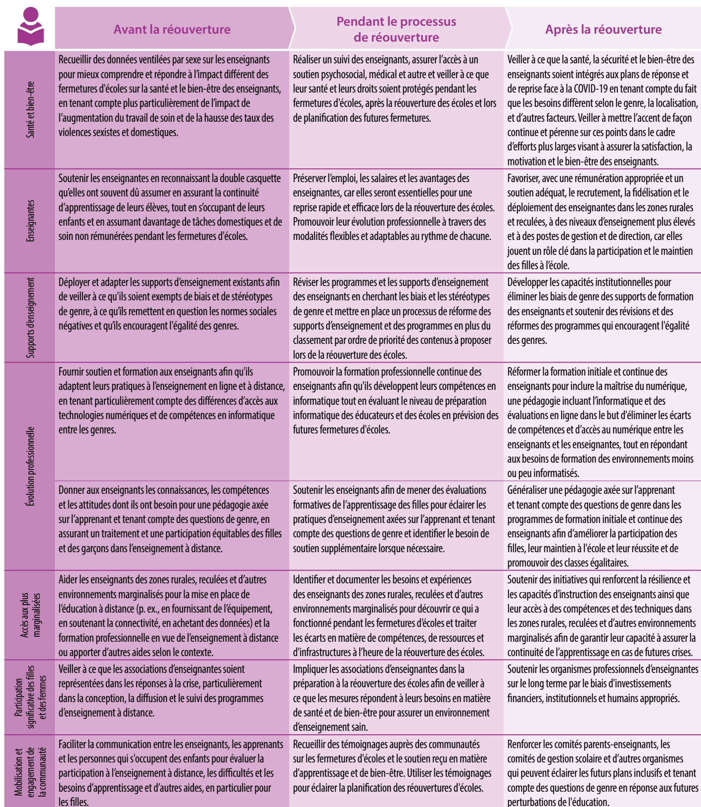
Tableau 4. Actions recommandées pour soutenir les enseignants