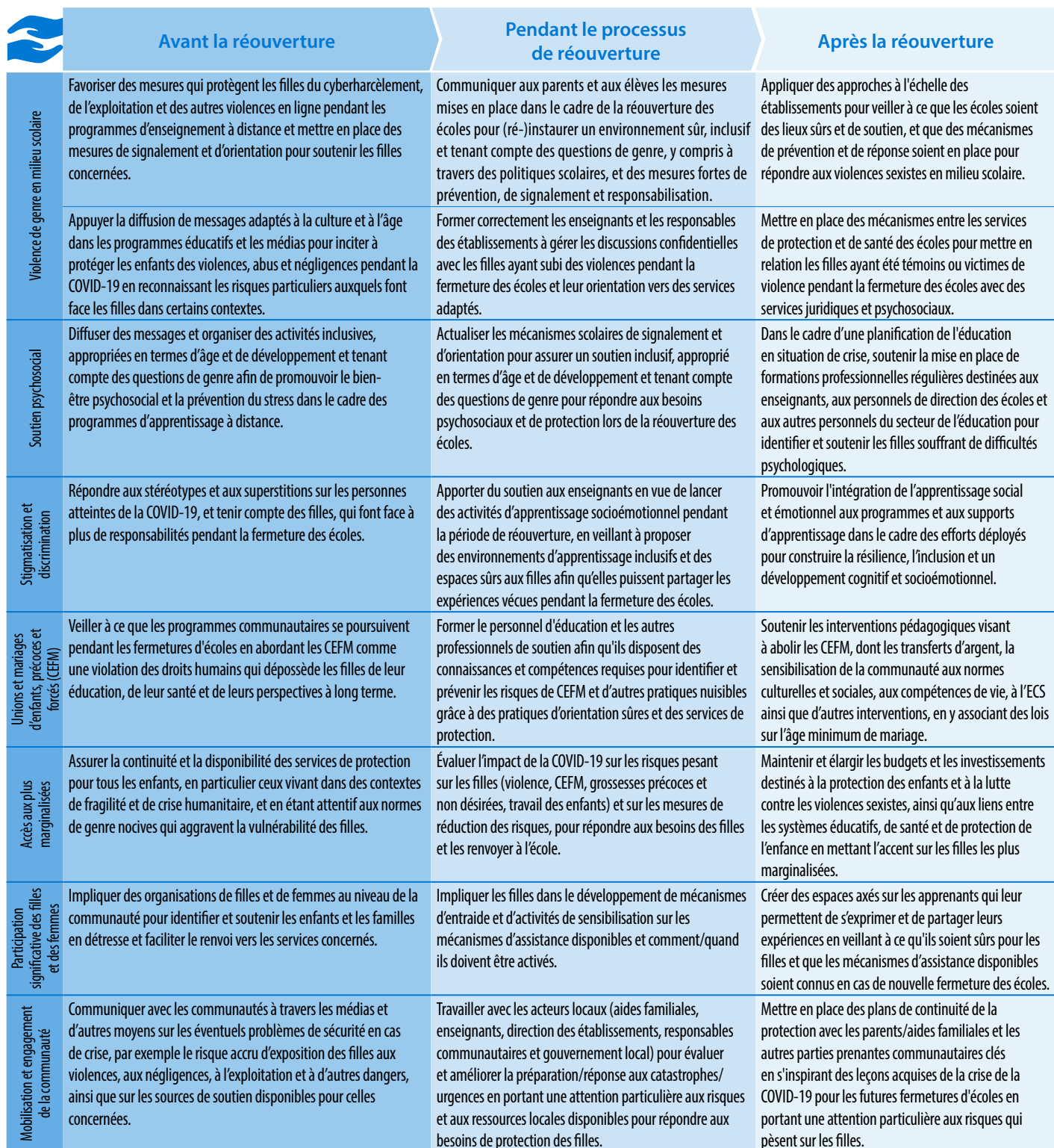
Tableau 3. Actions recommandées pour soutenir la protection des filles