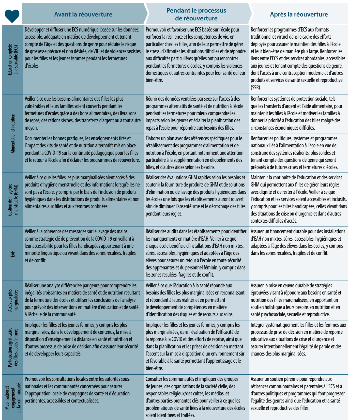
Tableau 2. Actions recommandées pour soutenir la santé, la nutrition et l'EAH