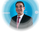
Justin Yifu Lin