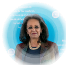
S.E. Mme Sahle-Work Zewde

Présidente de la commission internationale